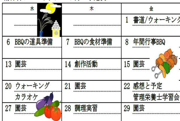
精神科ショートケア 9月 予定表

※ 本誌に掲載している写真については、ご本人の了解を得ていることを付け加えます。