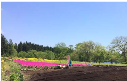
手前は耕した畑の土、中ほどのピンクはシバザクラ、奥の黄色い草は雑草です。

北秋田市のほとんどの地域で田植えが終わり、田んぼには苗が整然と並んでいます。水を張った田んぼは空を映し、期間限定の風景が広がっています。当ショートケアの利用者さんたちも、実は農家をやっている方が数名います。田植えの疲れを抱えつつも、ショートケアでも農作業を頑張っている姿には頭が下がります。