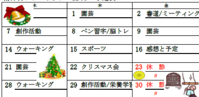
精神科ショートケア 12月 予定表

※ 本誌に掲載している写真については、ご本人の了解を得ていることを付け加えます。