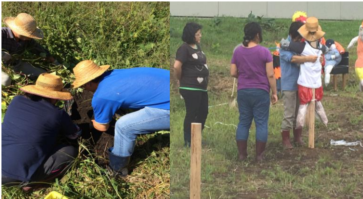
左：サツマイモのサイズが気になります。 右：かかしの取り付け風景。

稲刈りの風景をあちこちで見かけるようになりました。先日は中秋の名月も見事でした。畑で採れる野菜もだんだん秋の物に変わってきています。9月のダンデライオンでは、引き続き農作業を頑張