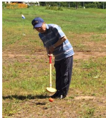
練習風景です。晴天のもと、

今年の夏も非常に暑い日が多く、秋田県でも最高気温を更新する地点が相次いだようです。そんな日にデイケアがなくて良かったです。暑かった分、畑で育てたスイカやメロンは店頭に並ぶものといいい勝負になるほどおいしくなっており、農作業後のおやつとして大活躍でした。