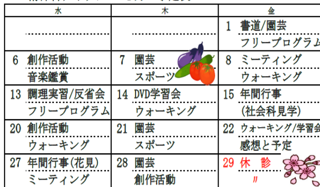
精神科デイケア 4月 予定表

※ 本誌に掲載している写真については、ご本人の了解を得ていることを付け加えます。